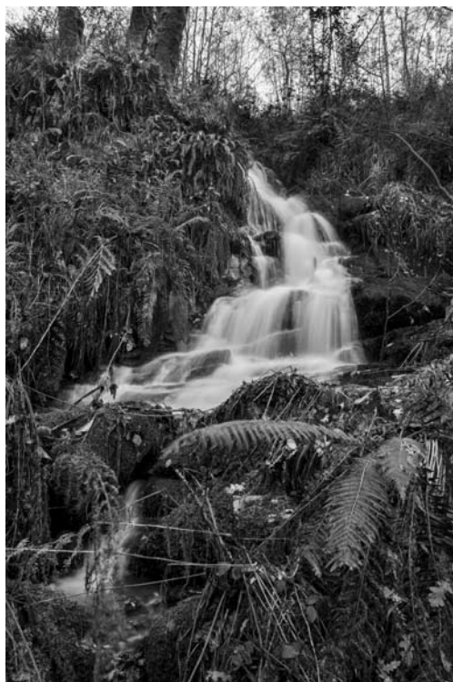
A Fervenza de Ouzande, aínda que non moi grande, si salva un desnivel importante, adornada con diversos tipos de feitos, entre os que destacan Blechnum spicant e Driopterix filix-mas