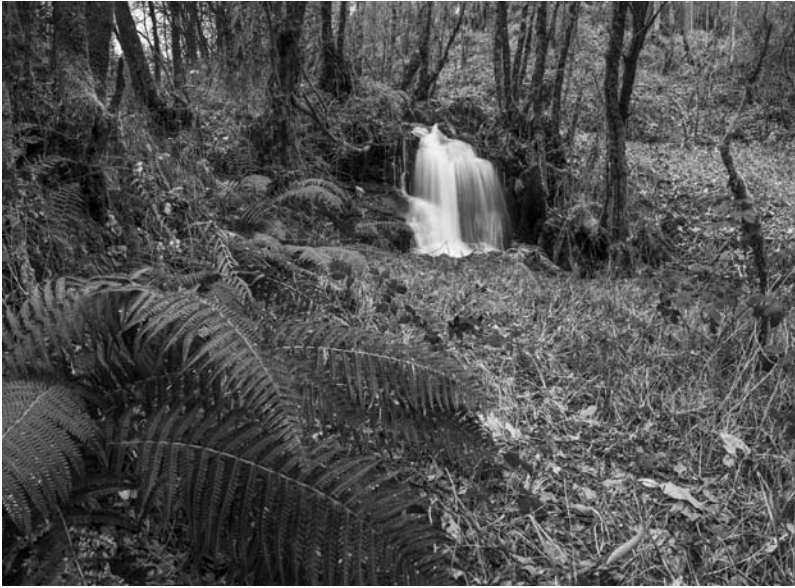
As fentas (aquí uns pés de Dryopteris filix-mas ) son unha constante ás beiras do rego da Pinguela. E, ó fondo, a pequena ferverza da Freixa, a primeira que forma o regueiro na parte alta do seu curso.

En sintonía co clima desenvólvese a cuberta vexetal, que neste caso –e case para o total do conxunto do concello– sería unha formación fitoclimática de carballeira termófila ( Ruscus aculeati-Quercetum roboris ), que reflicte as condicións climáticas expostas. Isto é: un clima hiperhúmido cun pequeno período de seca estival. Compoñen así a vexetación primixenia (ou dito de outra maneira, a vexetación natural do lugar) os carballos ( Quercus sp. ), salgueiros ( Salix sp. ), ameneiros ( Alnus sp. ), bidueiros ( Betula sp. ), freixos ( Fraxinus sp. ), acibros ( Ilex aquifolium ), aveleiras ( Corylus avellana ), loureiros ( Laurus nobilis ) que perviven nas beiras do cauce fluvial –e seguramente na maioría do territorio– despois de rexenerarse a partir do abandono paulatino dos usos tradicionais da contorna que se viñan facendo até despois da metade do século pasado, en que todo empezou a mudar.