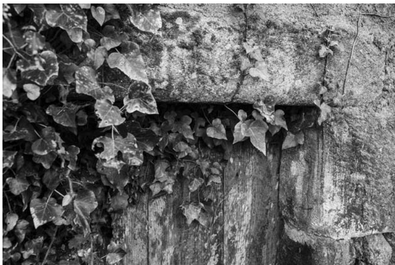
Cruces na xamba e lintel da porta no muíño do Cura

O fronte do muíño do Cura está invadido por hedras e vexetación, se ben pode contemplarse mercé a que está fronte a un pasteiro limpo. O resto do edificio atópase semiagochado entre a maleza, que se abre paso tras o seu abandono.