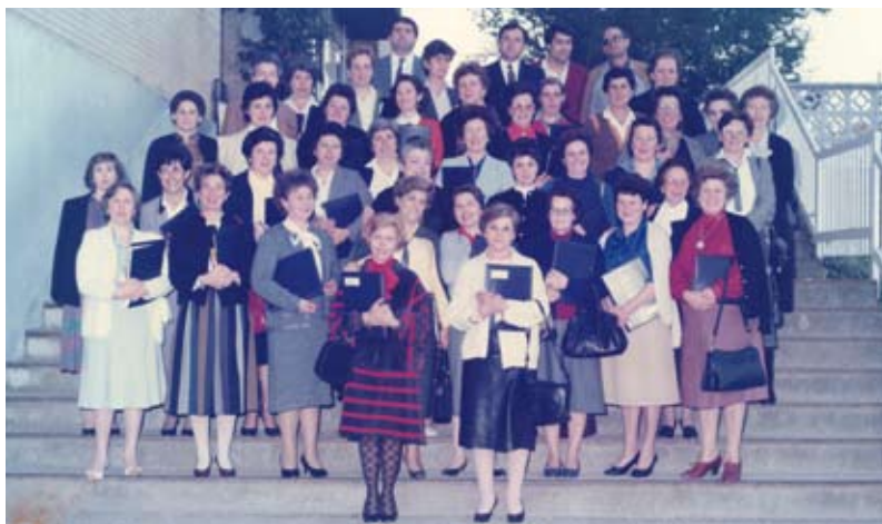
1985 Alumnas e profesores do curso de electricidade. De esquerda a dereita e de abaixo a enriba: