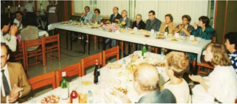
05.08.1987. Entrega de 4 bandeiras no Casino da Estrada.