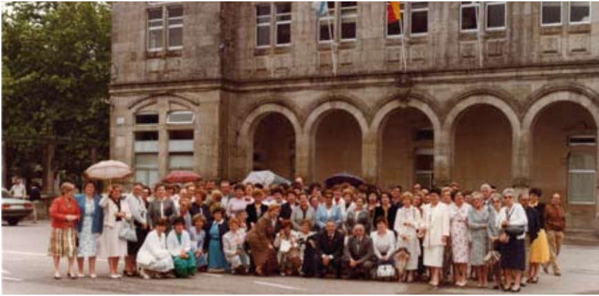
1985 Día Provincial Asociación A. C. Rías Baixas. Recepción no Concello.