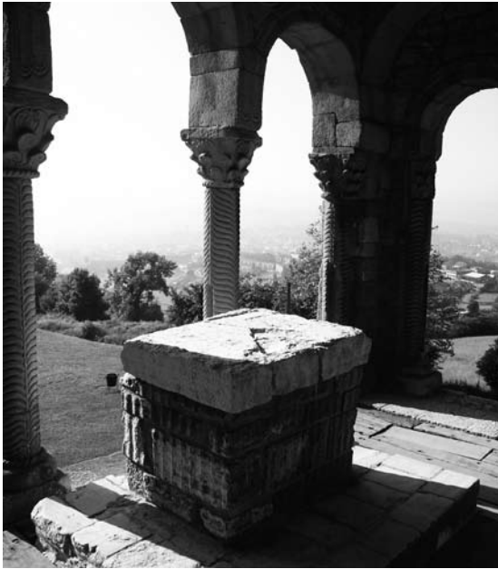
Figura 11. Altar Santa María del Naranco