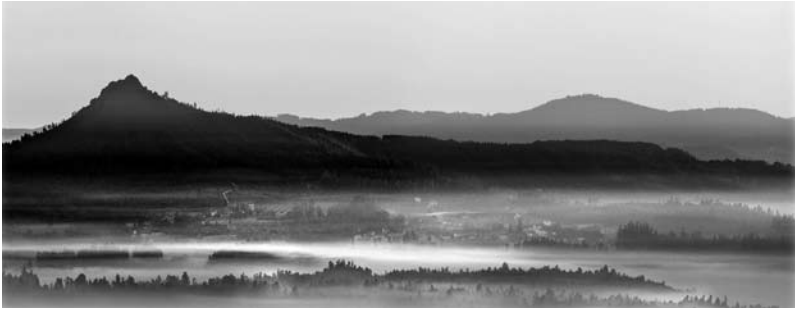
Figura 6: Pico Sacro