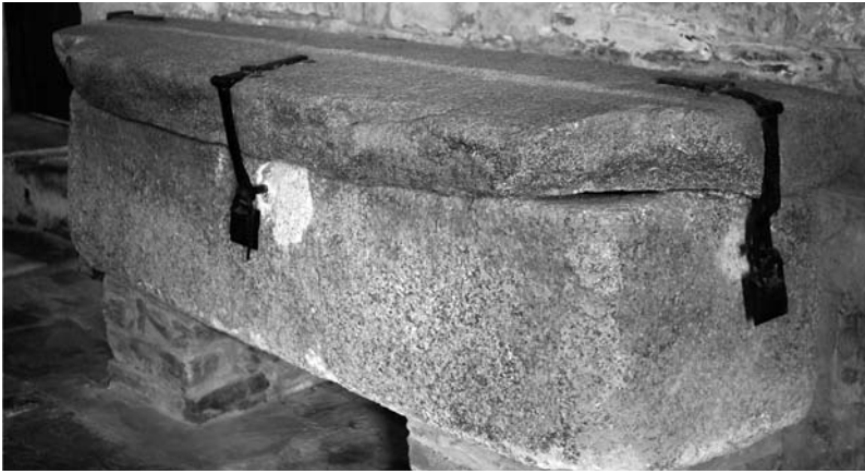
Figura 4.

Es interesante destacar también que el sepulcro lo hemos encontrado lleno de tierra, desconocemos el por qué, pero coincidiendo con lo que se encontraron los investigadores que redescubrieron los restos del apóstol Santiago a finales del siglo XIX, tal y como ellos mismos relatan en El Expediente del Proceso de reconocimiento de la autenticidad de las Reliquias del Apóstol Santiago el Mayor y sus discípulos Atanasio y Teodoro : «inspección in situ “... de los huesos deteriorados y mezclados con tierra, los superiores en mejor estado de conservación”» 3 .