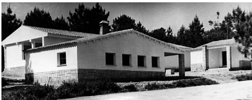
Vivendas escolares en San Xurxo de Veá.

26.10.1968. ESCRITO DE LA ALCALDÍA-PRESIDENCIA SOBRE CREACIÓN DE PREMIO LITERARIO PARA NIÑOS DEL MUNICIPIO.