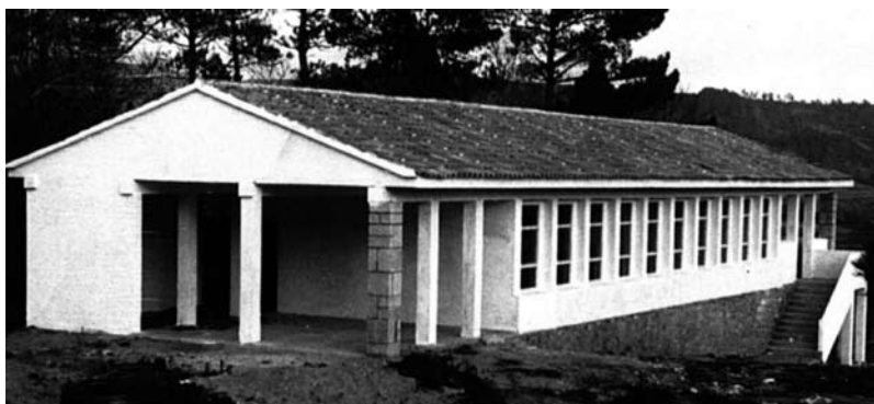
Grupo escolar de Rivala.