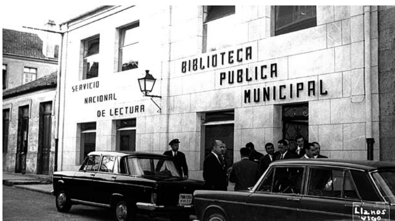
Chegada das autoridades.

27.4.1962. INSTALACIÓN BIBLIOTECA PÚBLICA.