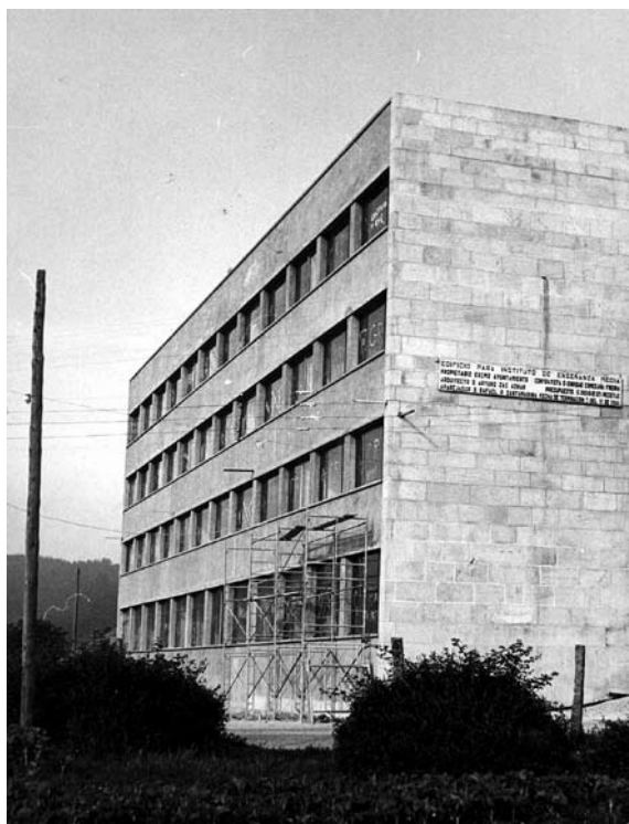
Edificio do Instituto Nacional de Ensino Medio da Estrada na súa derradeira fase de construción.