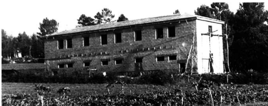
Agrupación escolar de Loimil durante a súa construción.