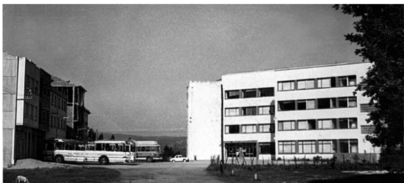
O Instituto no 1970. A Av. de Benito Vigo Munilla aínda sen trazar.