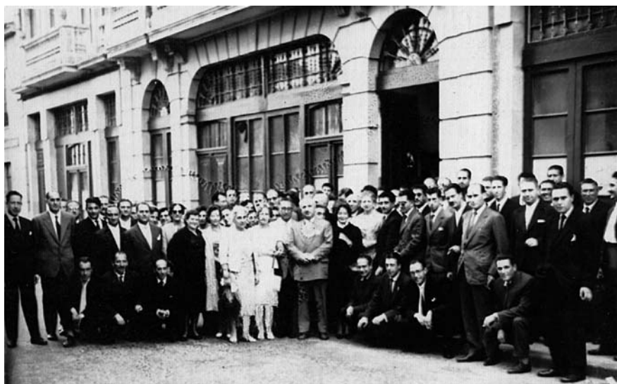
Profesores e ex alumnos do Colexio Libre Adoptado Inmaculada Concepción da Estrada na homenaxe rendida aos profesores, 30 de agosto de 1959.

Freiría, de Vigo, que después de haber sido anunciada la subasta de las obras por dos veces consecutivas y haber sido declarada desierta, solicitó la construcción por adjudicación directa, posibilitando hacer el edificio para el cual teníamos concedido el crédito necesario.