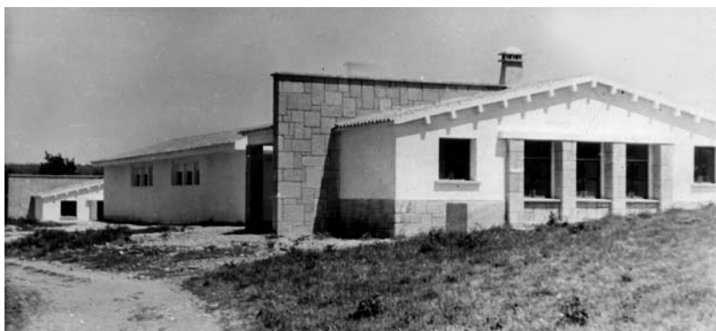
Vivendas de mestres e escolas en Cereixo.