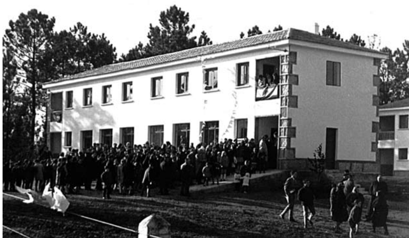
Grupo escolar e vivendas de mestres, Guimarei, o día da inauguración.