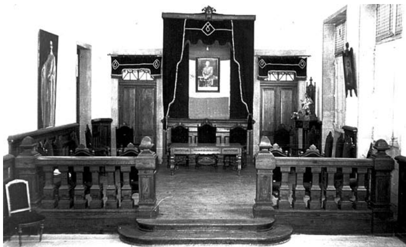
Estrado da corporación municipal. Consistorio da Estrada.