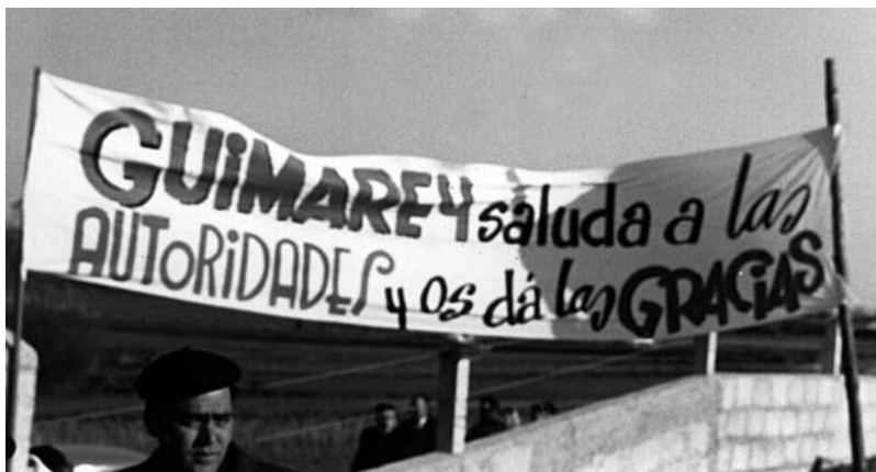
Guimarei, inauguración do centro escolar.

lleva rigiendo los destinos del municipio, treinta y tres grupos escolares, estando ocho más en construcción, teniendo ya adquiridos siete solares en distintas parroquias para otros nuevos.