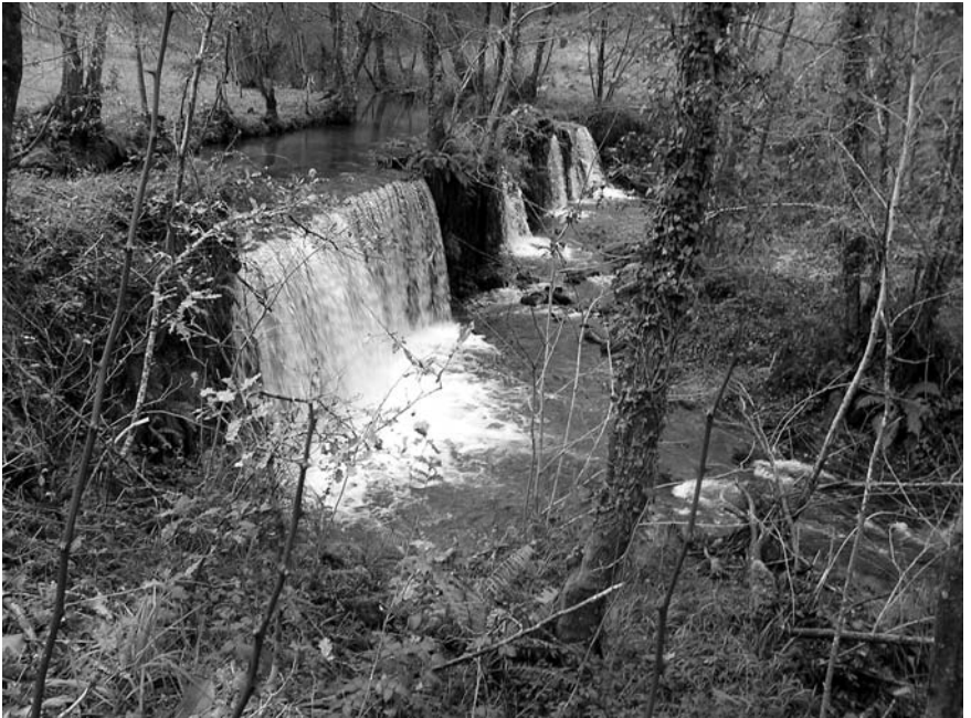
Bonita estampa da fervenza do río, moi perto da papeleira.

Aínda que aquí describe as edificacións, parémonos un pouco no edificio principal de planta rectangular toda de cadeirado, de 28 metros de longo e 12,5 de ancho que representan un total de 350 m 2 de parede, dando unha superficie interior útil de 204,5 m 2 . Pero se