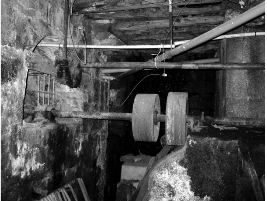
Restos dunha transmisión –á esquerda quedaba a turbina.

Papel satinado que sufría un proceso especial para facelo impermeable, do que eran grandes consumidoras as fábricas de chocolate marca “Raposo” e “Viso”.