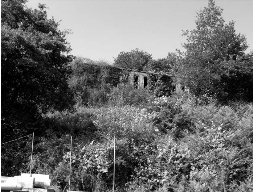
Edificio do secadoiro –hoxe en ruínas e cuberto de silvas.

establecían quendas de traballo. Pola noite quedaban homes e polo día mulleres.