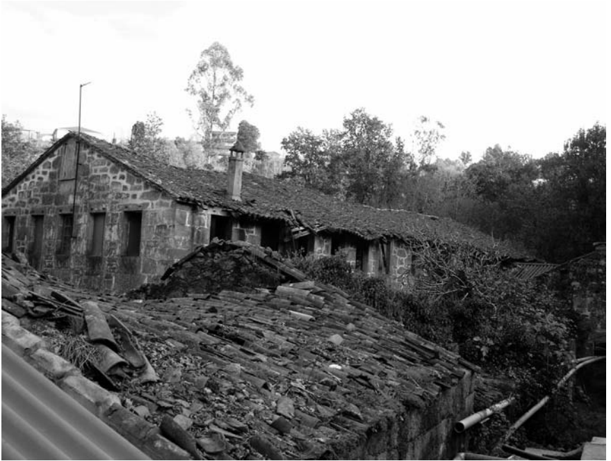
Estado actual dos tellados da nave principal.

emprego. Volta a transformar as instalacións para adicalas á explotación industrial de cría de troitas. As augas do río teñen fama de seren limpas e puras: para os pescadores seadeiros de Riobó é un cobizado río troiteiro. Xosé Manuel non tivo máis que construír estanques e adaptar a circulacións das augas para percorrer todo o circuíto do proceso de crecemento das troitas. A materia prima, as augas do río, estaba disposta e o demais andou só.