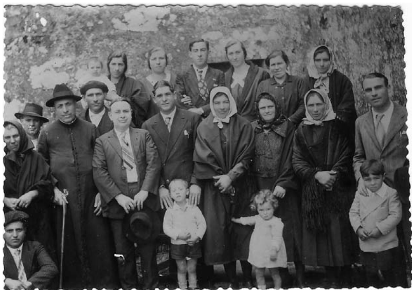
Fregueses co seu párroco.