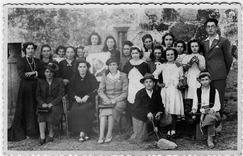
Elenco de actores do grupo de teatro parroquial de Codedesa mostrando un retrato do Papa Pío XII.