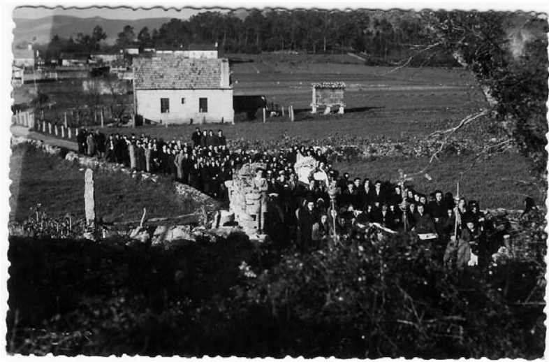
Panorámica dun sepelio en Fontenlo (Codeseda).