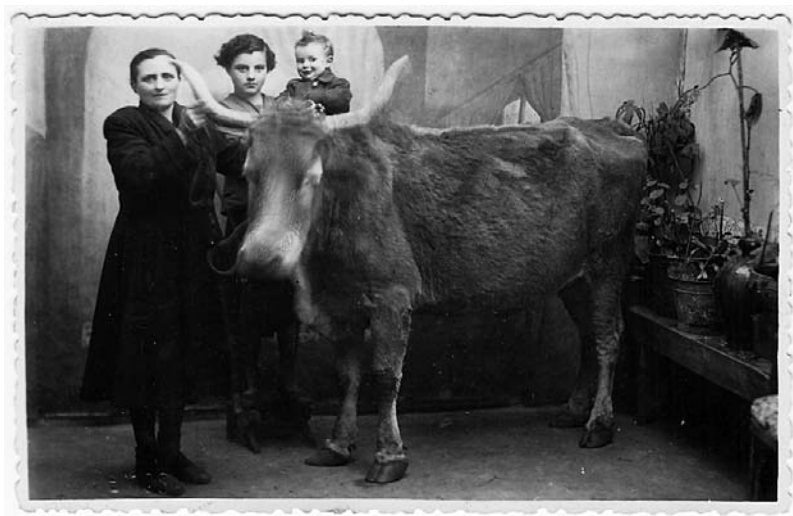
¡Inaudito! Unha marela no estudio do fotógrafo.