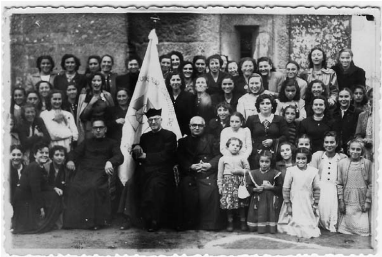
Reunión de Acción Católica de Codeseda.