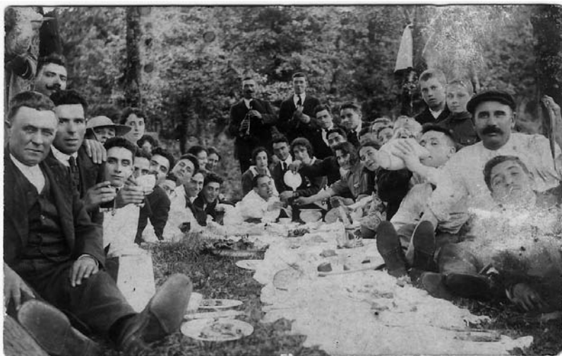
Xantar campestre na romaría da Guadalupe no campo da Grela.