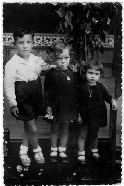
De maior a menor: tres irmanciños excelentemente retratados.