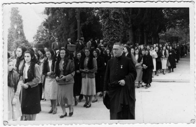
Peregrinación parroquial saíndo da Alameda de Santiago co seu párroco ó fronte.