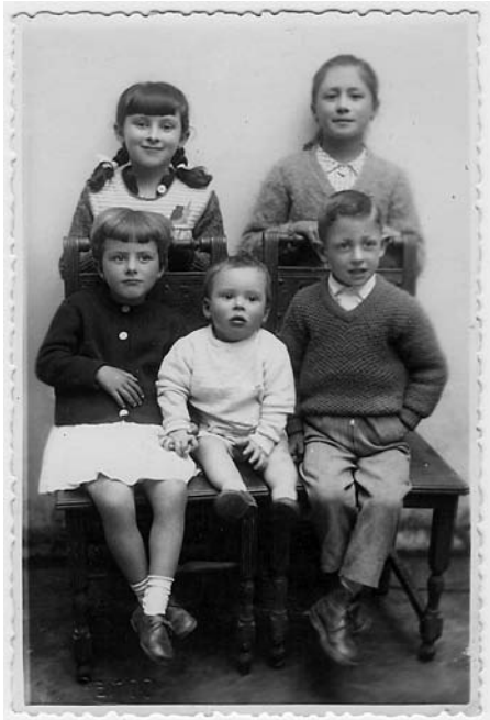
Simpático grupo de curmáns.