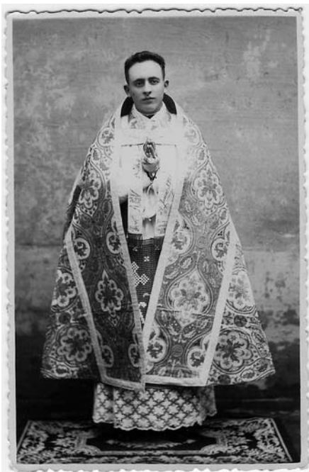
Sacerdote o día da súa primeira misa.