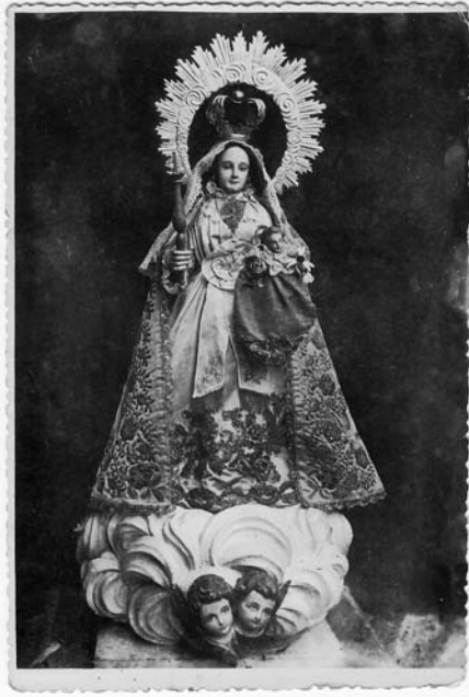
A Virxe da Guadalupe do Santuario da Grela (Codeseda), coloreada no retrato orixinal.