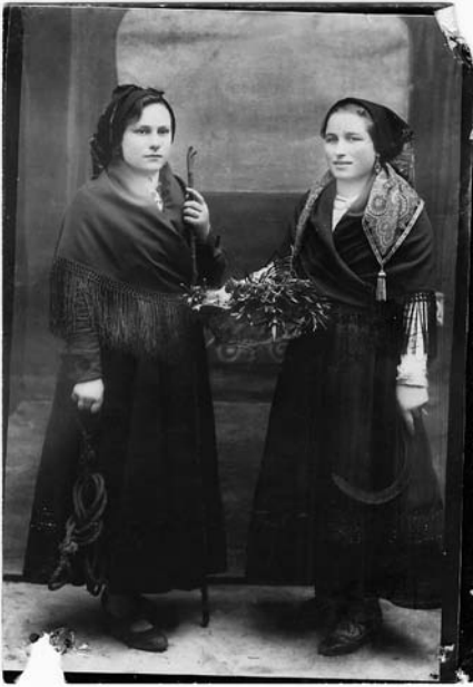
Dúas fermosas labregas de Codedesa retradas no estudio de Ramos.