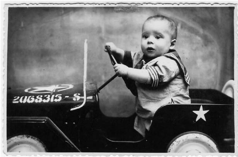
Aprendiz de conductor.