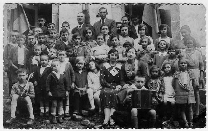
Mestres e alumnos coa bandeira española.