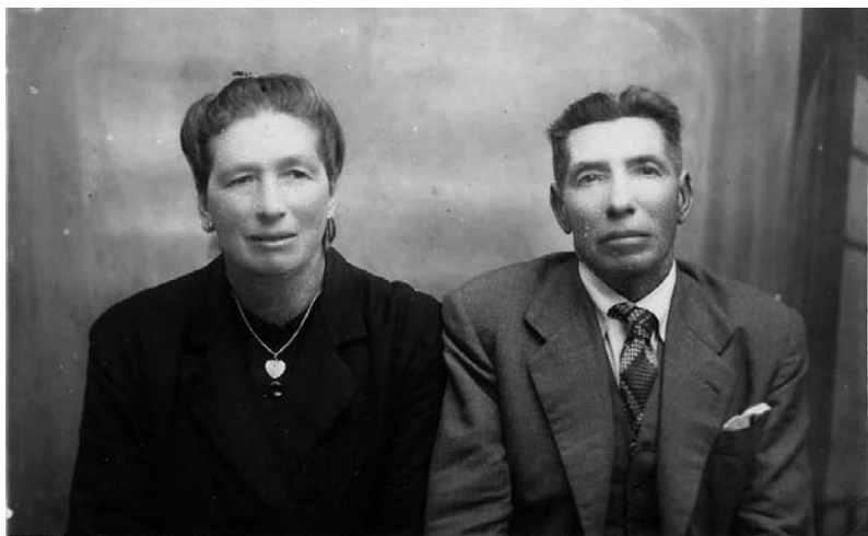
Retrato dun matrimonio de Castrelo (Forcarei).