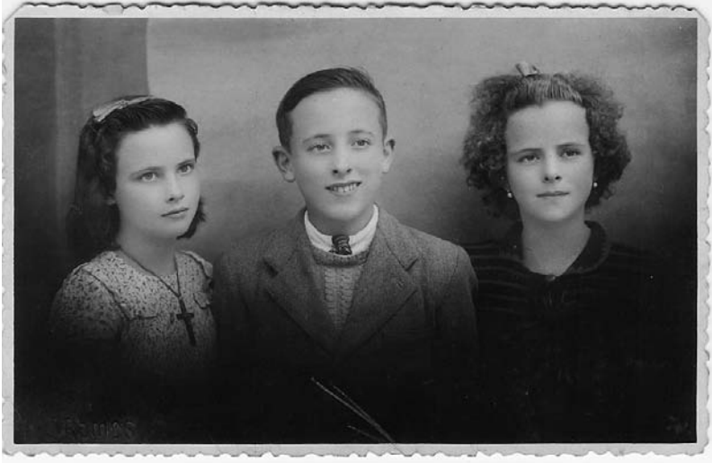
Tres irmáns. Apréciase no ángulo inferior esquerdo, troquelado na foto, o nome do autor: J. Ramos.