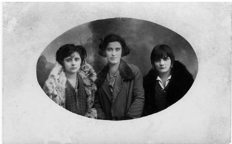
Tres amigas en formato elíptico.