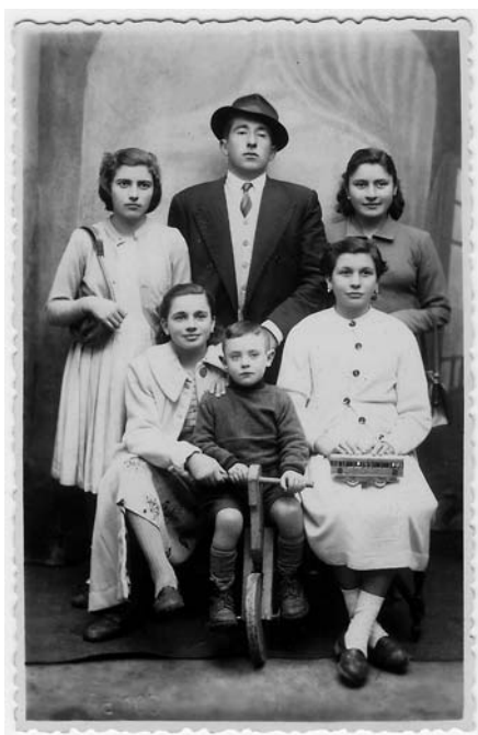
Familia con neno en bici ... de pau.