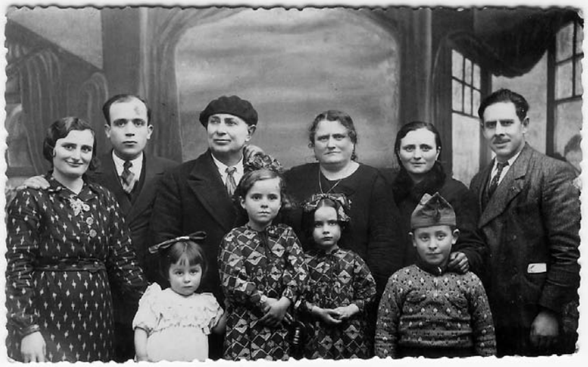
Foto familiar do retratista de Codeseda.