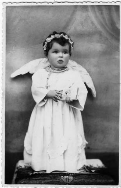
Un anxiño ben miúdo...