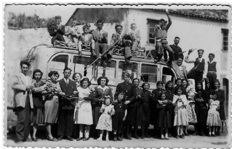
Saíndo de excursión.