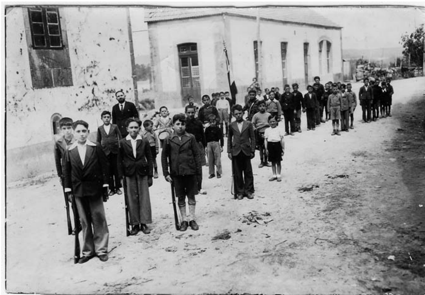
O batallón infantil, co seu capitán ó fronte, en plena parada militar.