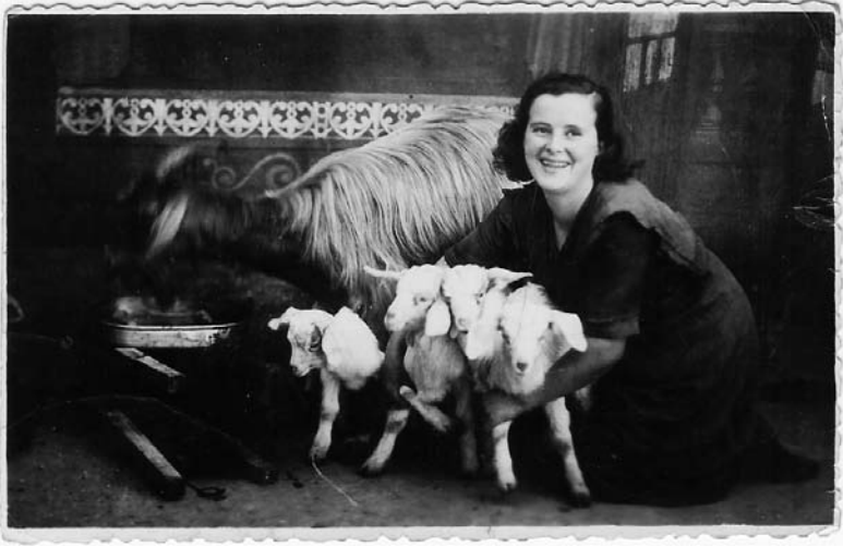
... e a cabra tivo cabritos. Foto no estudio de Ramos.