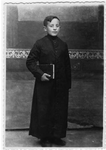
Neno seminarista coa sotana moi ben abotoada.