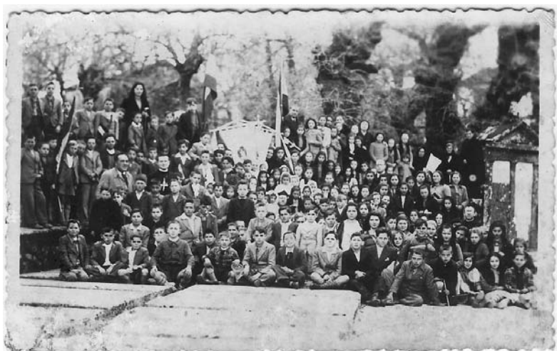
Xuntanza de nenos e catequistas no adral de Codeseda.