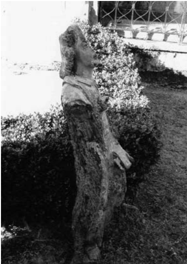
Estado actual da talla.

fragmento da faciana con restos de policromía. Por outra banda na Geografía de Galicia dirixida por Carreras y Candí, nun artigo de Gerardo Álvarez Limeses 4 aparece documentada esta imaxe mediante unha fotografía en branco e negro, datada no ano 1925. Na foto aparece a talla enteira sen signos de ataque da polilla e ó pé o seguinte texto: La Estrada – Siglo XV Imagen de San Juan en madera policromada, en Riobó.