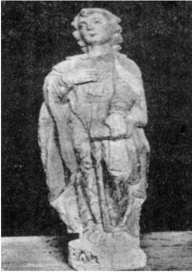
A imaxe de san Xoán no 1925.