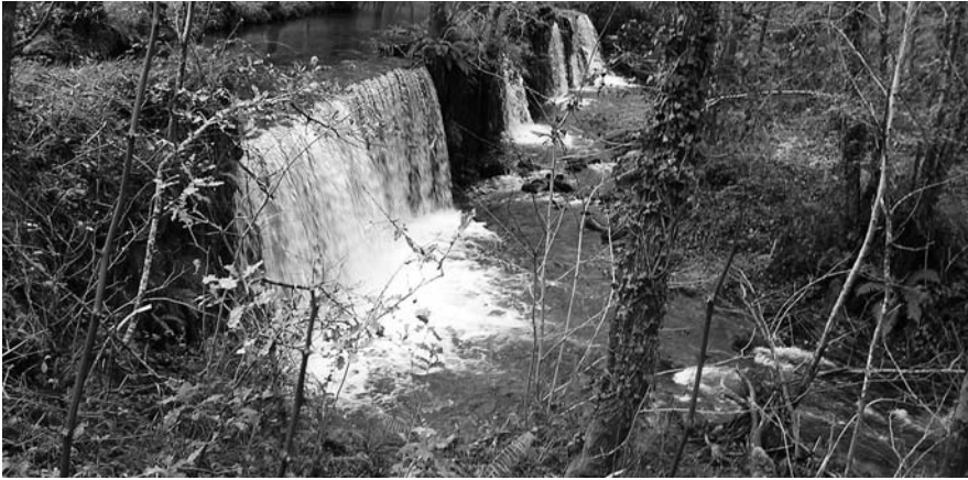
Fervenza a carón da ponte de Riobó.

rural tradicional, que se está a esvaecer e que na actualidade nin os máis vellos recordan xa.