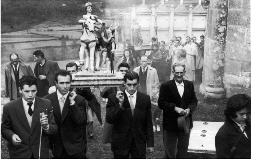
Procesión de San Martiño. Adro da igrexa de Riobó, ano 1962.