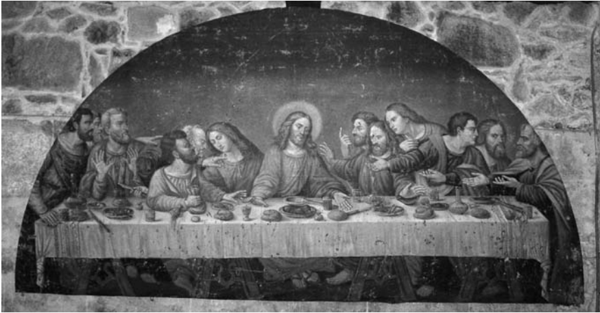
Vista xeral do cadro do pintor compostelano Garabal.

picaduras debido á machacadura das pedras e a acción do tempo. Tentamos rescatar esta pintura e restaurala o mellor posible para o que pedimos opinión a expertos restauradores pero as solucións eran moi caras e fóra do alcance das nosas posibilidades, polo que optamos por facer nós de expertos na materia.