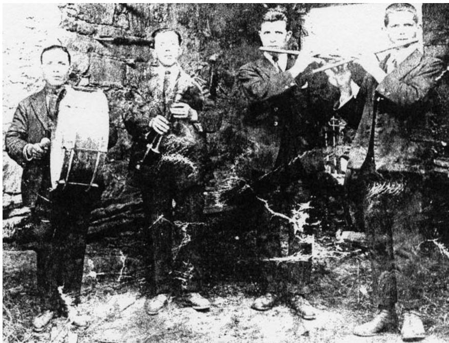
Requiteiros e gaiteiros de Remesar e Riobó gañan o segundo premio do concurso de gaitas de Lagartóns no 1916.