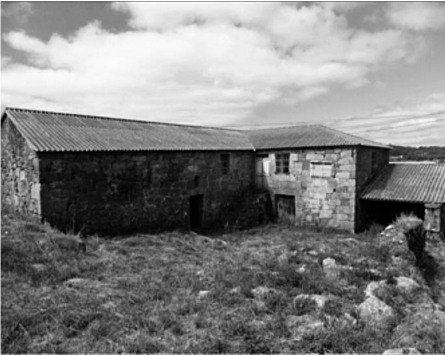
Casa de Barcia en S. Miguel de Cora.