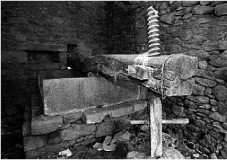
Lagar en la Casa de Barcia.