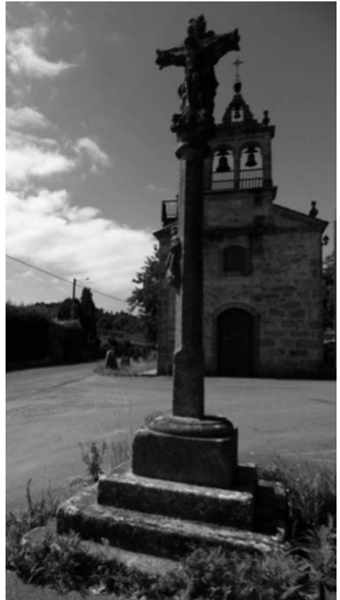
Cruceiro frente a la capilla dedicada a la Virgen de Aránzazu.

Nació en Santiago. Estudió medicina y pronto se distinguió no sólo como médico sino también como escritor. Fue médico titular del