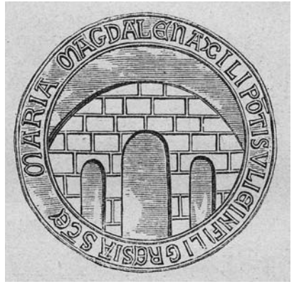
Debuxo do selo do concello de Ponte Ulla, editado por López Ferreiro. Fonte: Lecciones de Arqueología sagrada , p. 496.

Tempo despois continúa a presenza compostelá na freguesía de Arnois, coa doazón realizada en 31 de marzal de 1214 polo arcebispo don Pedro Múñiz ao Cabido da metade que lle correspondía do beneficio de San Xiao, aclarando López Ferreiro que a institución posuía xa propiedades na freguesía; resalta o autor “lo conveniente que podía ser a los Canónigos esta cesión para ayudarles en el cultivo de las viñas que por allí tenían” 14 ; unha doazón confirmada pouco despois polo pontífice Honorio III, a petición capitular, do ius quod habetis in