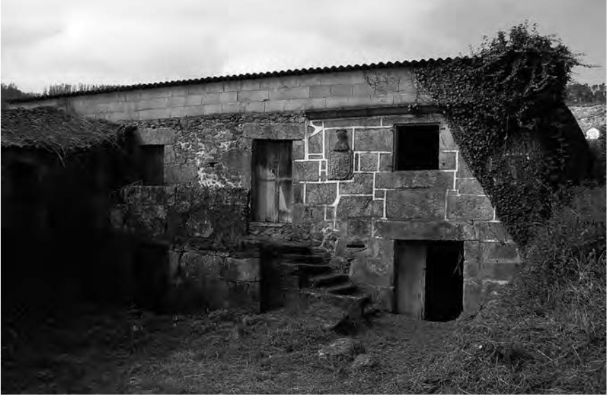
A casa da Silva antes de su restauración.