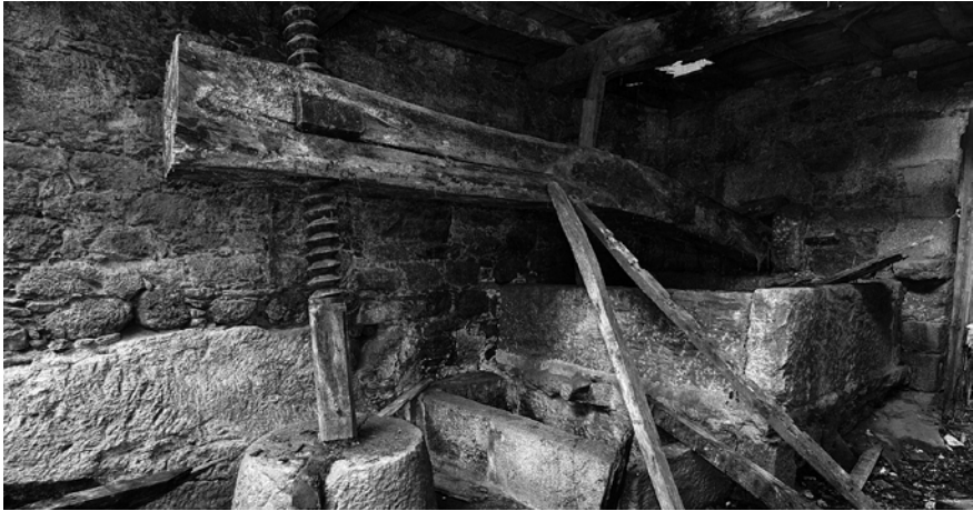
Prensa de lagar ás beiras do Ulla.

Mais o que de seguro moitos lectores ignoren é que varias freguesías do actual concello da Estrada foron berce, fogar, acubillo e mesmo lugares de investimento dos máis sobranceiros impresores galegos. Sen dúbida a proximidade a Compostela –centro principal do movemento tipográfico galego– fixo da nosa comarca un “hinterland” axeitado ás necesidades e anxeios destes próceres do coñecemento moderno.