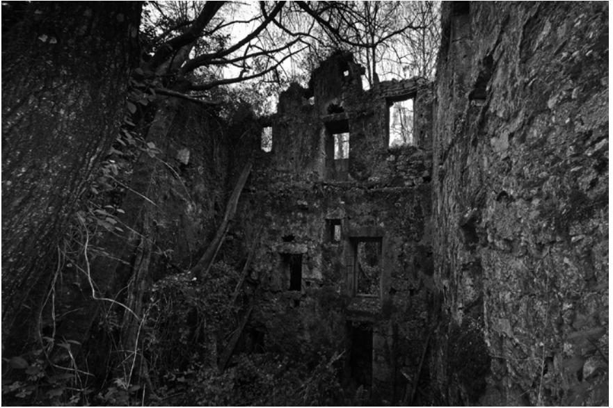
Ruínas da fábrica de papel de Loimil.

tucións eclesiásticas e académicas —a universidade, sobre todo—, puido dar traballo a máis dun impresor ao mesmo tempo nos séculos XVII e XVIII.