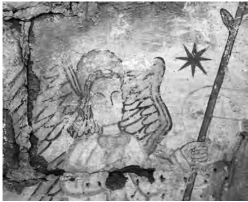
Arcanxo Gabriel. Anunciación de Nigoi

ubicación das pinturas, ambas as dúas no hastial da ábsida, sobre e arredor do arco triunfal, circunstancia perfectamente acorde co modelo compositivo arquetípico: San Gabriel á esquerda, a Virxe María á dereita e no centro, sobre a clave do arco, a representación simbólica da divinidad ou mesmo o Espírito Santo en forma de pomba. A base pictórica das pinturas de Riobó redúcese a unha delgada capa de cal mentres que as de Nigoi foron executadas sobre un revestimento de morteiro. As imaxes son lineais, case esquemáticas e a paleta de cores extraordinariamente reducida: ocre e amarelo nas súas diversas tonalidades.