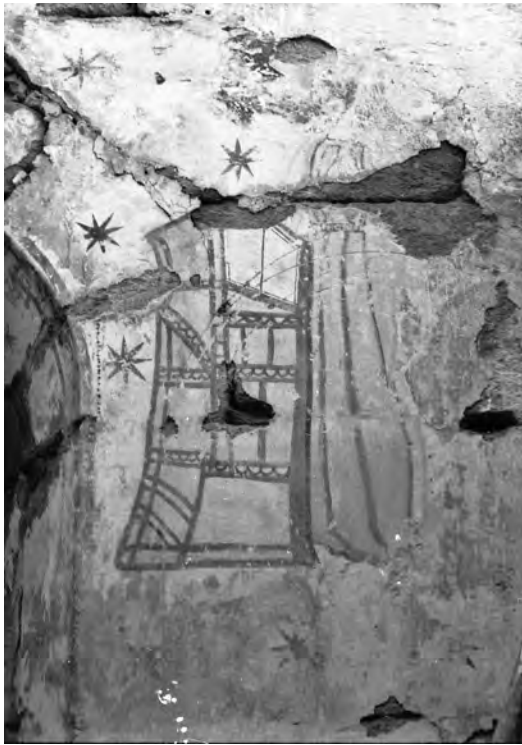
Virxe María. Anunciación de Nigoi.

No lado oposto aparece a Virxe María tras dun reclinatorio elaborado con sinxelos trazos lineais. Lamentablemente da figura marianna apenas trascenden detalles significativos: o manto, que cae paralelo ao mole frontal ou reclinatorio, e as mans unidas, apenas visibles, en actitude de recollemento e oración. Apréciense noutros lugares restos de figuras que completaban a escea.