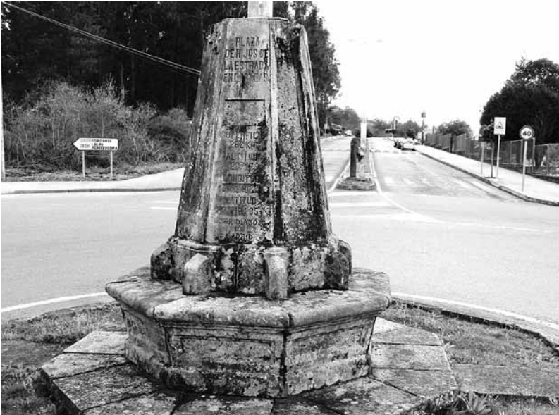
Actual situación da antiga farola do concello, na Praza de Hijos de A Estrada en Caracas.

za o 17 de novembro de 1948 e remata o 22 de maio de 1950, na Sesión Supletoria de data 28 de setembro de 1949, encontramos: