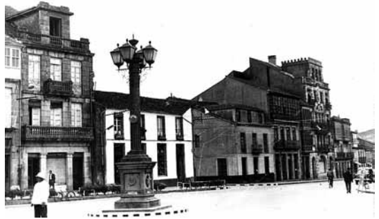
Farola no centro da hoxe coñecida como Praza de Galicia.