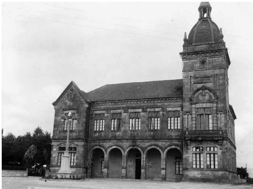
Panorámica da praza do concello coa farola.

A un porvenir venturoso consagra este lateral: digno es pueblo tan leal de paz, justicia y reposo.