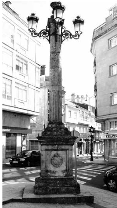
Nun recanto da Praza do Mercado encontramos aquela farola cos escudos da Estrada e de Obras Públicas.

Para deixar a farola coas súas molduras tal como estaba, aproveitáronse as pedras procedentes do derribo da praza de abastos, e mesmo se puxo unha tubería no interior para permitir o enganche posterior do farol de coroa. O traballo foi realizado pola empresa “Construcciones Fontela” cun presuposto de 350.000 pts. aprobado polo concello o 10 de abril de 1984.