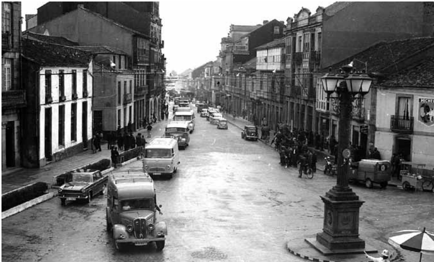
A praza antano denominada “del Generalísimo”, a popular Farola, nunha foto dos anos sesenta.

Travesía de La Estrada en la carretera de Chapa a Carril Km. 20,495 al 21, 936 se ha dispuesto lo que sigue: