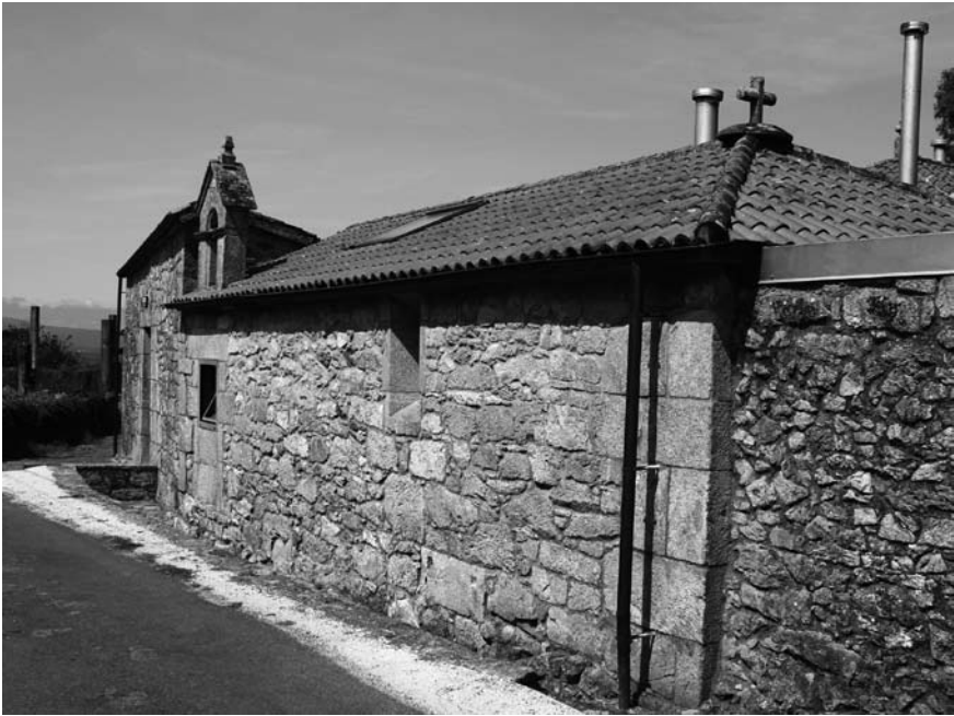
Capela de Nosa Señora da Paz.

16, como así certifica o notario D. José Jacinto Álvarez de Neira e Reimóndez.