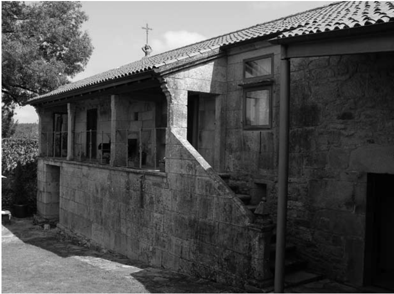
Solaina do pazo.

vio pago de 875'50 reais. As misas estaban cargadas sobre uns bens vinculados, pero as leis desvinculadoras facían ilóxica esta carga.