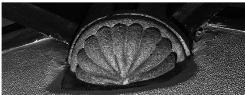
Ménsula da sancristía.