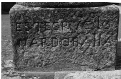
Inscripción do cruceiro.