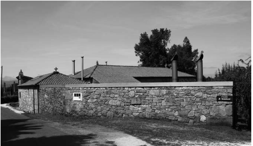
Pazo A Nugalla.

Otero, do pazo de A Mota 18 , por outros en Curantes. As escrituras fixéronse como se cada un lle fixera un foro ao outro. Pero en 1834 os sucesores do Neira Infanzón reclamaron as terras por ser vinculadas, o que motivou un preito 19 entre os sucesores de ambas familias. En Tabeirós déronlle a razón aos Recarei, pero a Real Audiencia fallou a favor dos Otero.