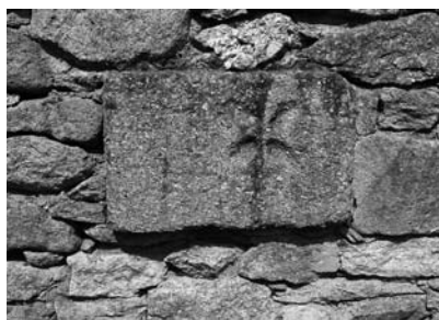
Cruz de Malta.