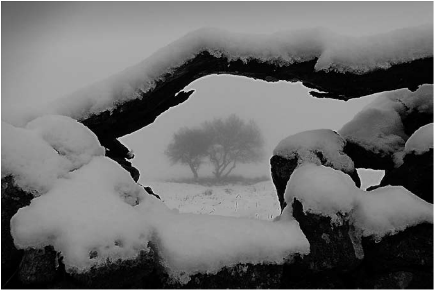
Brañas de Xestoso en inverno.