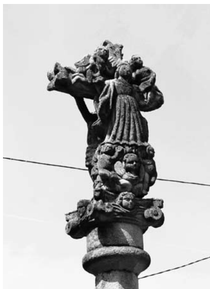
Ascensión e Coroación da Virxe.