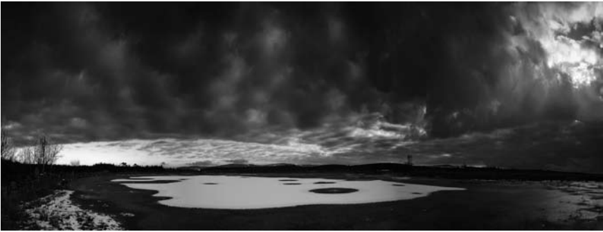
Lagoa Sacra xeadá.

coche) das Brañas de Xestoso e da Lagoa Sacra, zonas húmidas protexidas de media montaña, que forman parte da Rede Natura, que combinan natureza e biodiversidade, ideal para os amantes da natureza, pois alí poden observar gran diversidade de réptiles, anfibios, plantas, paxaros 4 e animais como o lobo ou o raposo. As vistas e paisaxes son fermosos e relaxantes. Desde o punto máis alto (700 m.) pode divisarse Santiago, A Estrada e todo o Val de Trasdeza.