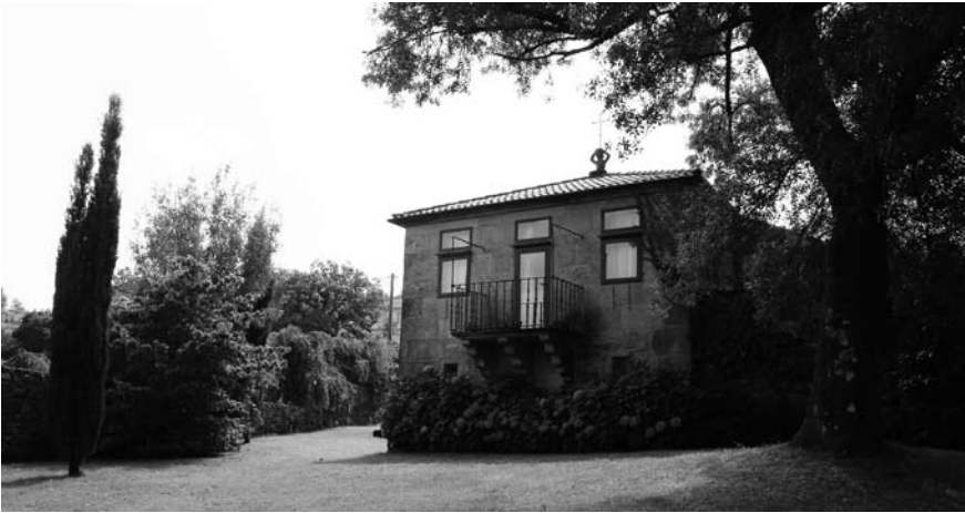
Pazo A Nugalla.

había sobre uns bens vinculados, polo que actualmente xa sen retablo e sen uso cultural foi reconvertida na biblioteca da casa.