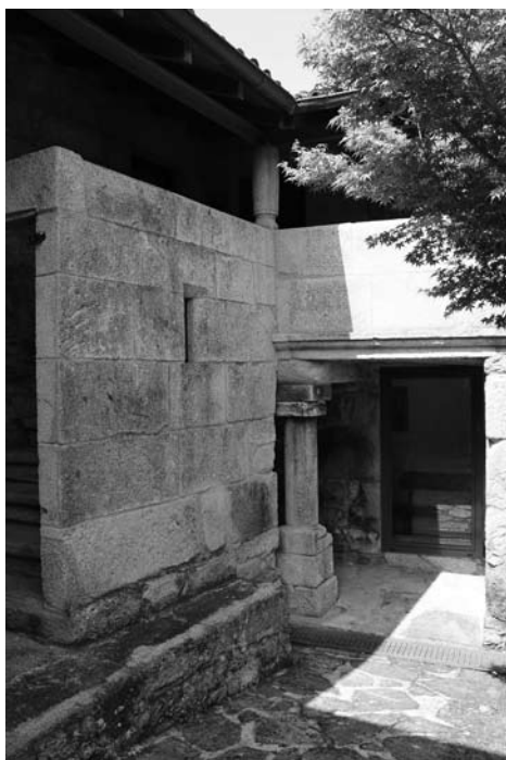
Solaina da casa adxacente.