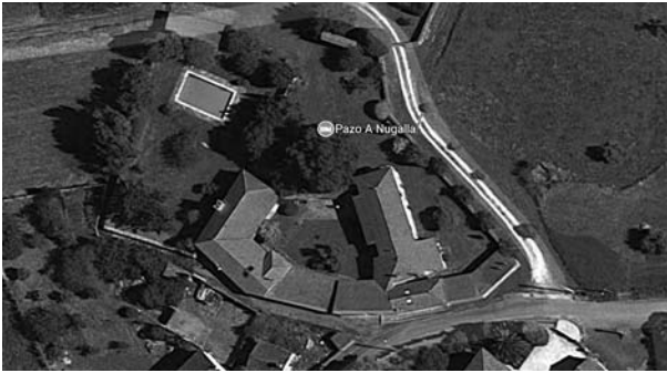
Vista aérea do Pazo de Nugalla.

e capela máis ou menos. E dado que esta cheminea está claramente levantada sobre unha edificación bastante máis antiga, que xa sufrira aditamentos como se ve claramente ao mirar as paredes, temos que dicir que esta casa foi levantada no século XVII ou antes.